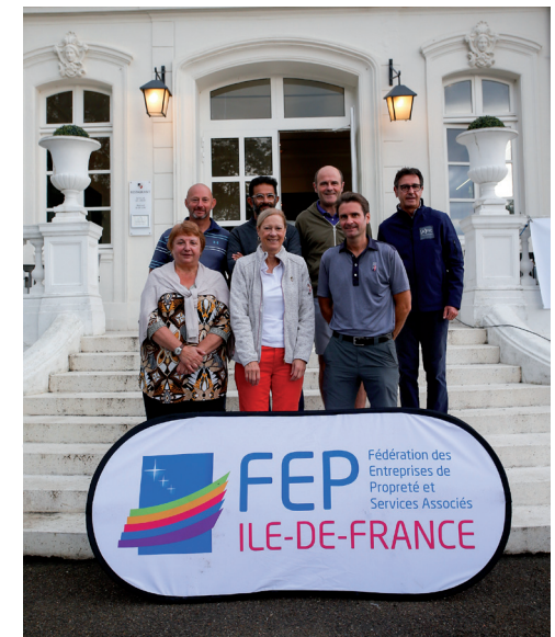
Equipe de la FEP