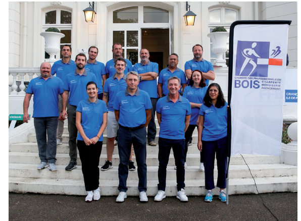
Equipe Bois - Verre